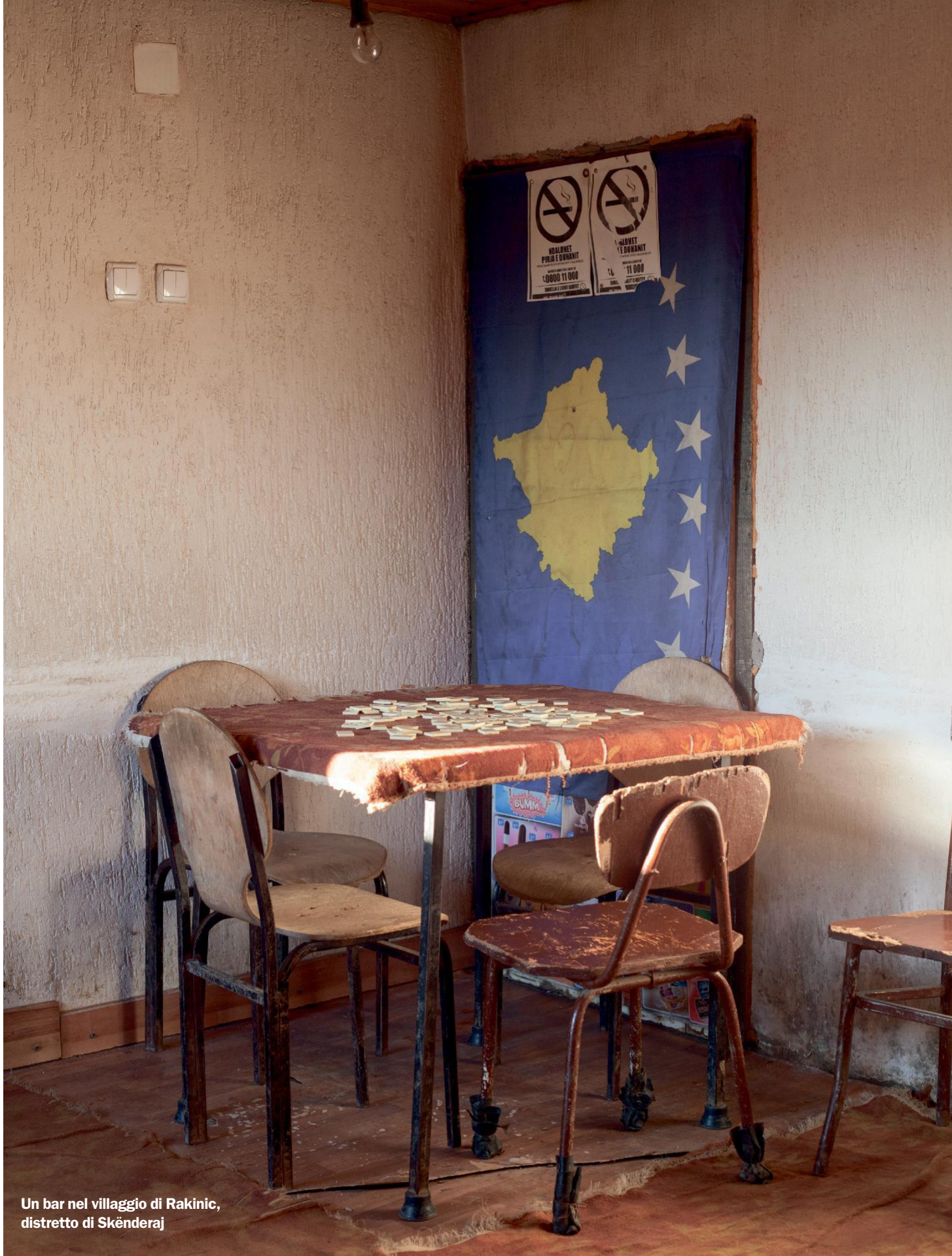
Un bar nel villaggio di Rakinic, distretto di Skënderaj