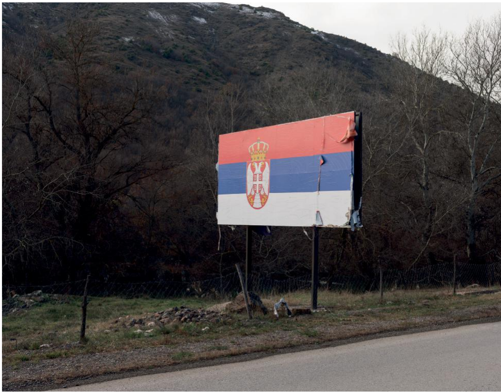
Bandiera serba a Leshak. A sinistra: una riproduzione della Kaaba della Mecca nel teatro della scuola coranica Allaudin di Pristina. Sotto: "Missing", monumento al popolo serbo nella città di Graçanica