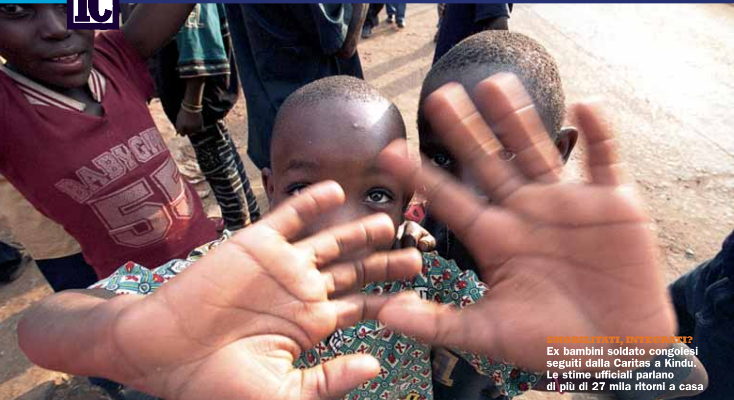
SMOBILITATI, INTEGRATI? Ex bambini soldato congolese seguiti dalla Caritas a Kindu. Le stime ufficiali parlano di più di 27 mila ritorni a casa