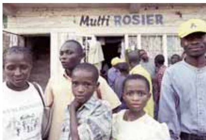
VERSO LA NORMALITÀ Studenti di Kindu aiutati da Caritas

Il presupposto su cui si basa l'intervento psicopedagogico e psicoterapeutico è che i bambini tornati dalla guerra sono stati in primo luogo vittime. Le piste neurocorticali che si sono create nei loro cervelli, ancora in fase di formazione negli anni di guerra, determineranno nuove sofferenze personali e nuovi traumi sociali. La dimensione morale e spirituale della loro persona è stata parimenti distorta, e oggi fatica a rispettare la vita, l'altro, le regole della convivenza umana. Ma a questi ragazzi va riconosciuto il diritto a un'altra chance : oggi restituiscono il male che è stato loro inflitto, domani la pianta della loro vita potrebbe dare frutti migliori.